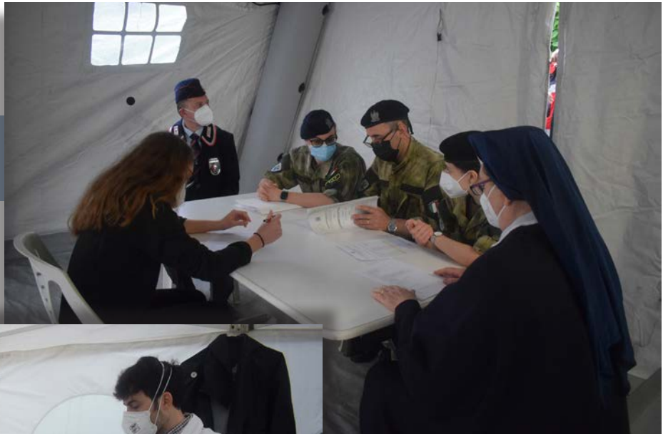
Visita dei candidati con la seconda commissione medica