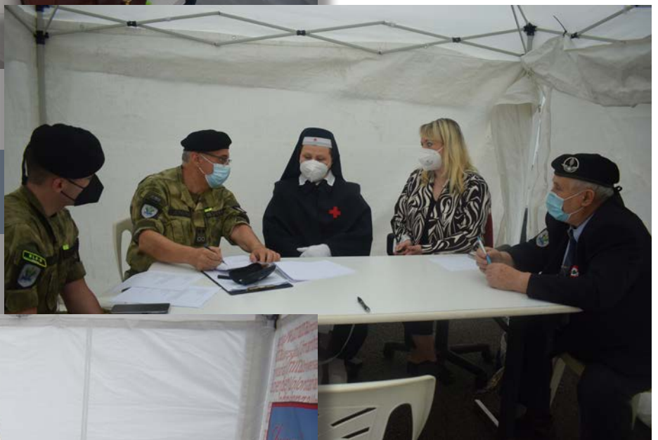
Visita dei candidati con la prima commissione medica