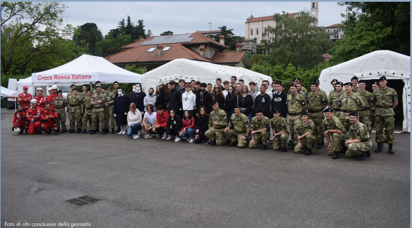
Foto di rito conclusiva della giornata