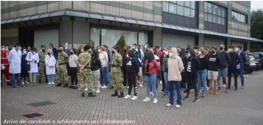
Arrivo dei candidati e schieramento per l'alzabandiera