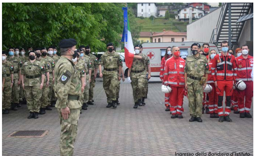
Ingresso della Bandiera d'Istituto