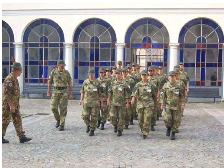
Lezione di addestramento formale

Ogni giorno infatti, dopo l'alzabandiera,