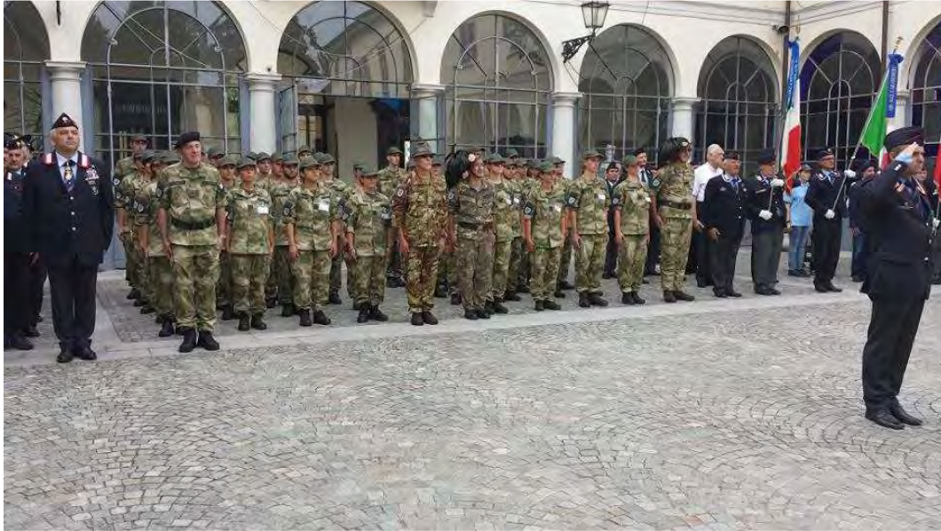
La cerimonia conclusiva del 1° Corso Libertà

Infine i saluti conclusivi, qualche lacrima di rammarico per la fine della bella esperienza e l'immane "rompete le righe" con il lancio del copricapo.