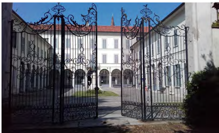
Casa Militare Umberto 1° - Il cortile d'onore

L'idea nata tra i Coordinamenti Provinciali di Como delle Associazioni Nazionali Carabinieri, Bersaglieri e Autieri con il convincimento che era necessario fare qualcosa di utile e di concreto per le ragazze e i ragazzi che negli ultimi anni hanno perso importanti opportunità educative rispetto a quelle che i loro genitori avevano avuto in passato come, per esempio, il servizio di leva. Ecco quindi l'idea di proporre un'esperienza unica e irripetibile a una quarantina di studenti delle classi quarte delle medie superiori, con l'obiettivo di formare delle nuove coscienze e di educarle al civismo, alla legalità, di far provare loro l'emozione di indossare un'uniforme, di fare propri i valori delle associazioni d'arma, lo spirito di corpo, il piacere di condividere con gli altri, la soddisfazione di fare qualcosa per chi ha bisogno o si trova in difficoltà, ma soprattutto per arricchire il loro bagaglio di esperienze e conoscenze e proporre anche la possibilità di un nuovo orizzonte professionale.