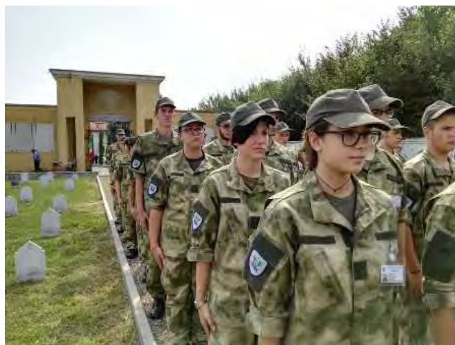
Gli allievi rendono omaggio ai reduci al cimitero di Turate

Domenica 4 settembre, ultimo giorno del 1° Corso Libertà, ha visto gli allievi impegnati dapprima nella Santa Messa nella chiesa parrocchiale di Turate e poi nella sfilata conclusiva alla presenza dei genitori,